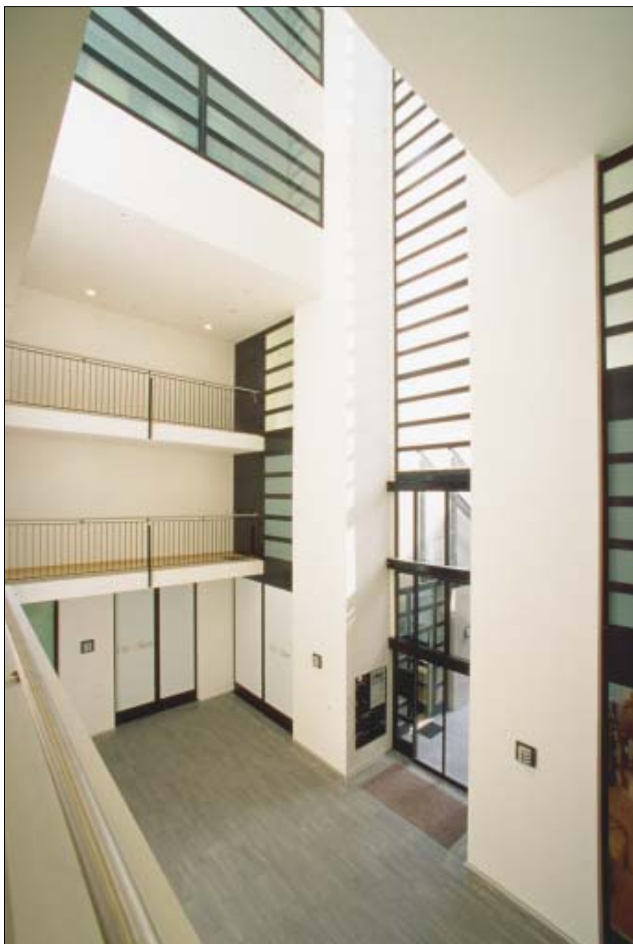
Cour intérieure de l'immeuble Terrassière no 23