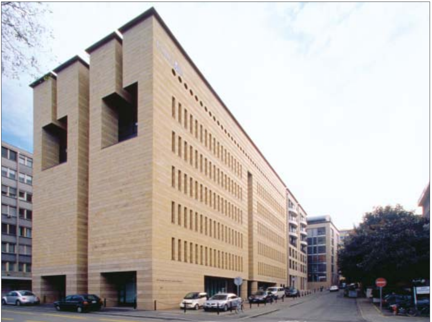
Vue d'ensemble Ilot Terrassière