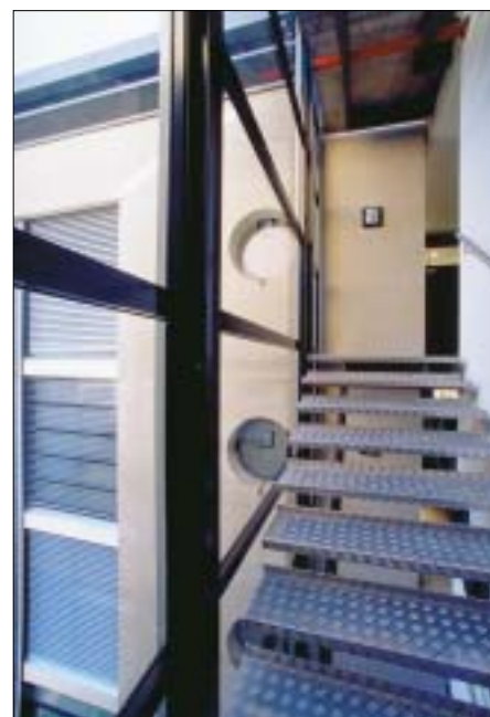
Escalier d'accès aux étages Terrassière no 23