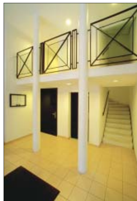
Entrée de l'immeuble rue de la Flèche no 5