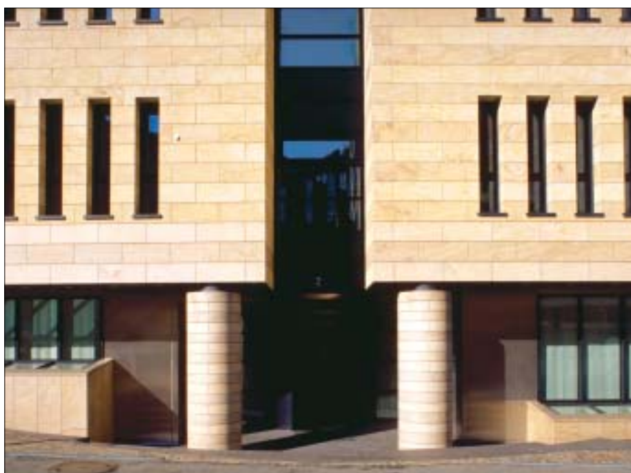
Entrée de ING-BBL