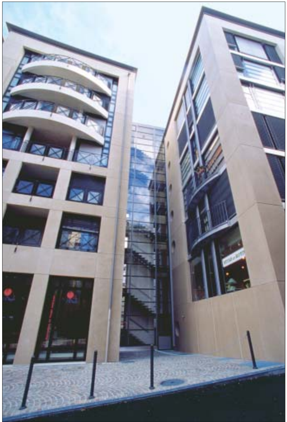
Escalier d'accès immeuble Terrassière no 23

Les solutions retenues pour la réalisation du projet englobent le traitement des aménagements extérieurs, eux aussi largement conditionnés par les exigences de la Ville. Celle-ci ayant pour intention de redéfinir la circulation motorisée dans le secteur, en réservant un espace séparé pour les transports publics, les concepteurs se sont trouvés dans l'obligation de régler trois des façades par rapport à leur juxtaposition avec le domaine public. Seul l'accès au noyau des distributions verticales restait à aménager pour obtenir une cohérence de niveaux et de traitement, notamment sur le plan des matériaux choisis, soit, dans le cas particulier, des pavés de grès porphyre.